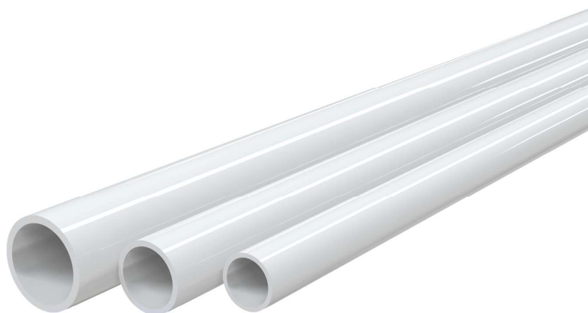
TCR-32 TCR-25 TCR-21

- cod. 11126324 - cod. SCD300034 - cod. SCD300033