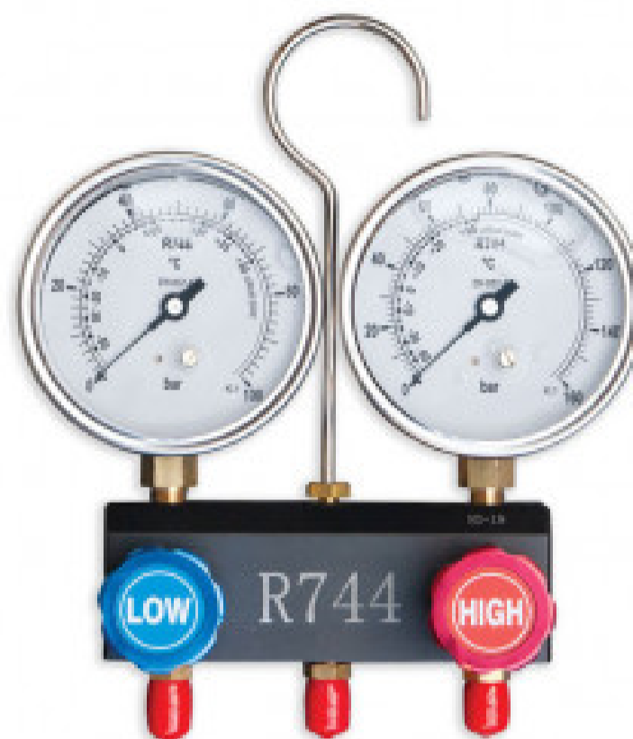
Gruppo manometrico a 2 vie con manometri GM-2-CO2-OIL-80-100/160BAR