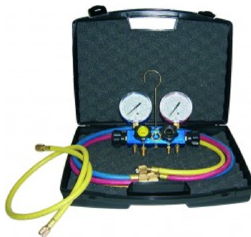
Kit valigetta con gruppo manometrico a 4 vie GM-4-S2-C1-80-PF-KIT - R32-410