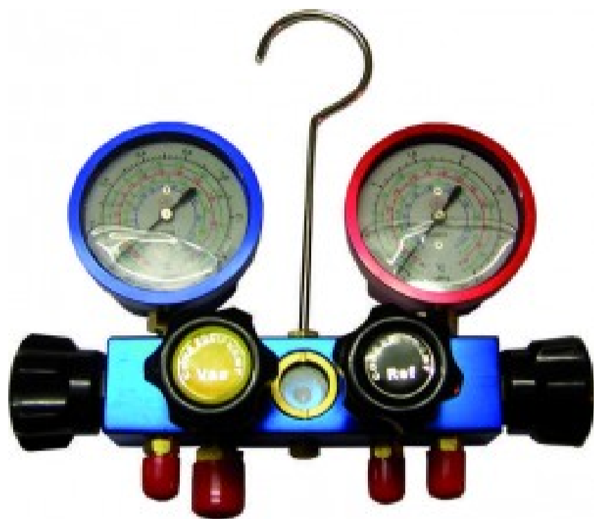
Gruppo manometrico a 4 vie con manometri GM-4-S1-60-GLI - R22-134-404-407