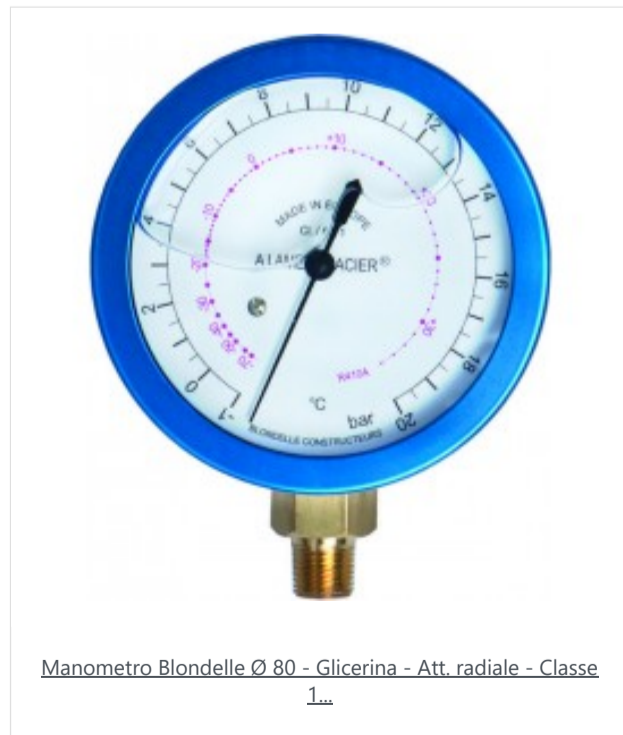
Manometro Blondelle Ø 80 - Glicerina - Att. radiale - Classe 1...