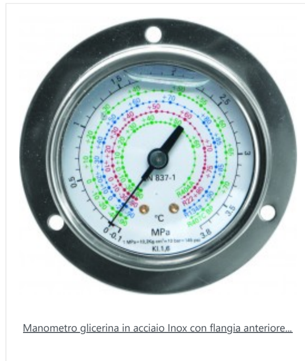
Manometro glicerina in acciaio Inox con flangia anteriore...