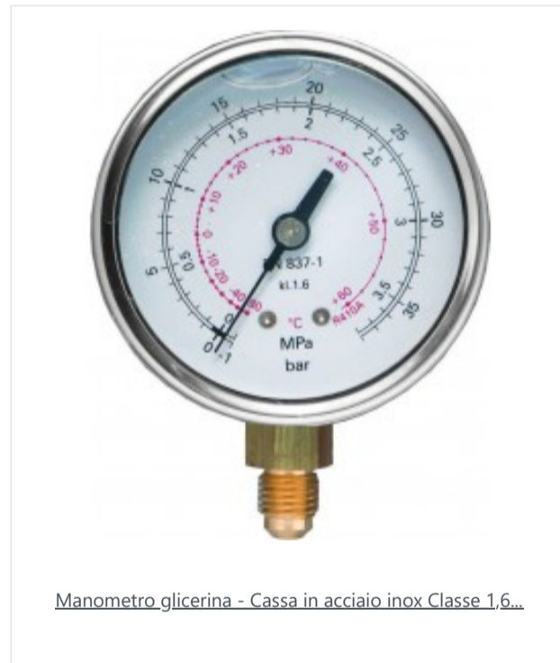
Manometro glicerina - Cassa in acciaio inox Classe 1,6...