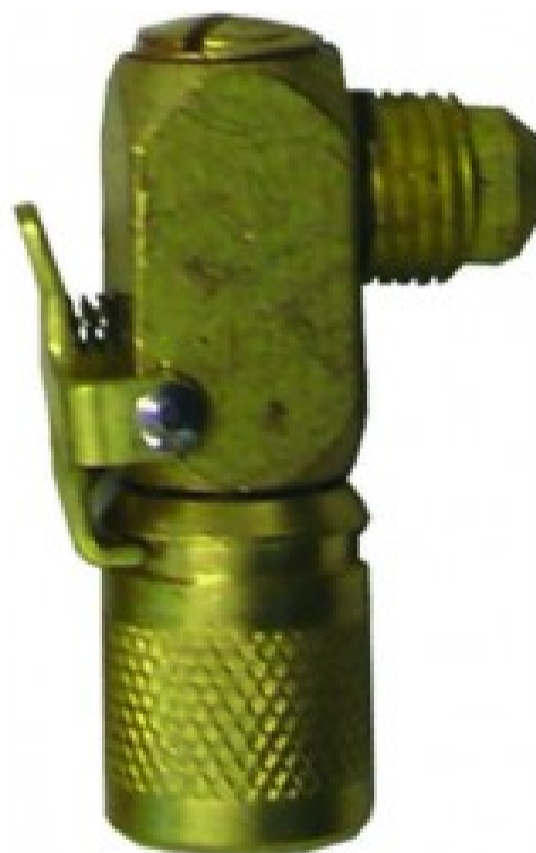
Attacchi rapidi 27 C - Att. rapido 90° 5/16 SAE maschio x 5/16 SAE femm