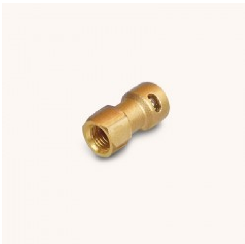
Giunto diretto 3/8" SAE f x 3/8" - Gator