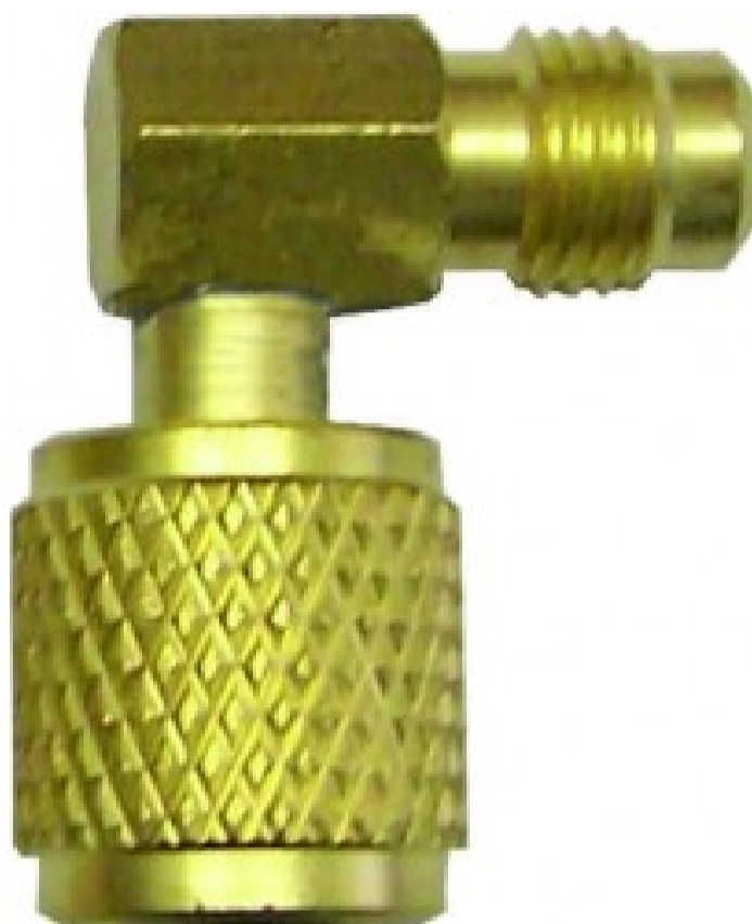
Raccordi girevoli a 90° RACC-GIR-1/4FX5/16M-90° - 1/4" x 5/16"