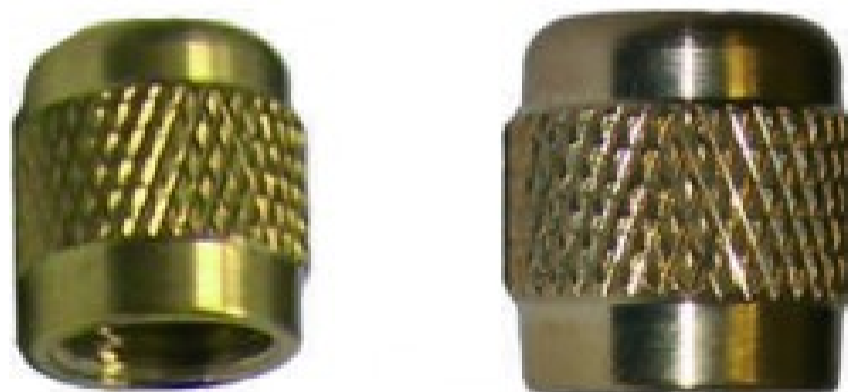
CAP1/4 - Cappuccio per valvole di carica 1/4 SAE