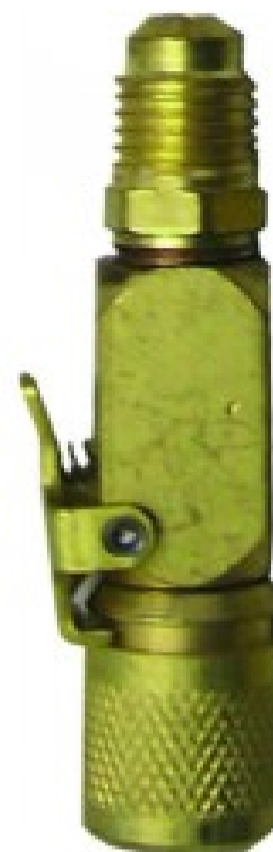
Attacchi rapidi 26 C - Att. rapido dritto 5/16 SAE maschio x 5/16 SAE femm