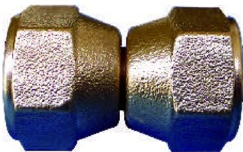
Doppio bocchettone girevole DB 5/8 - 5/8"