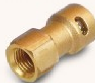
Giunto diretto 1/4" SAE f x 1/4" - Gator