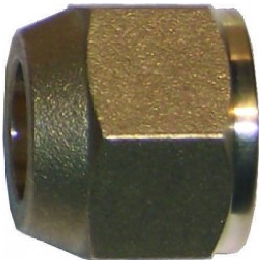
Bocchettoni ridotti per tubi in pollici NRS4-86 - 1/2"

16 altri prodotti della stessa categoria: