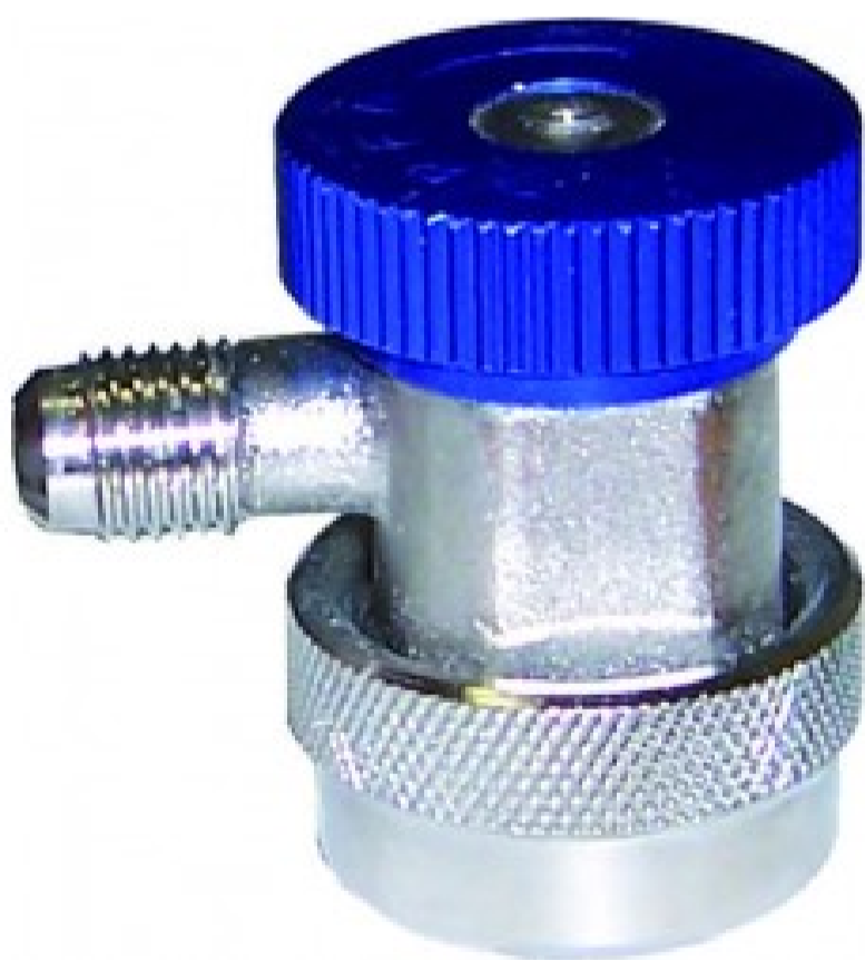
Attacchi ad innesto rapido ARB-134-1/4-bassa pressione - Bassa pressione