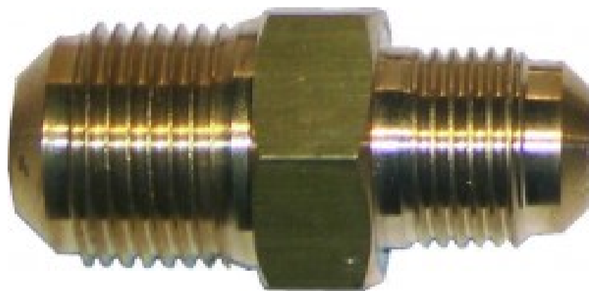
Giunti diritti ridotti a doppia cartella UR2-84 - 1/4"