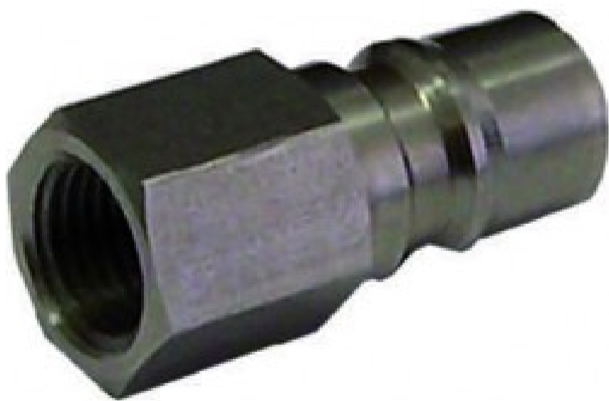
GRMH - Giunto rapido maschio Hansen