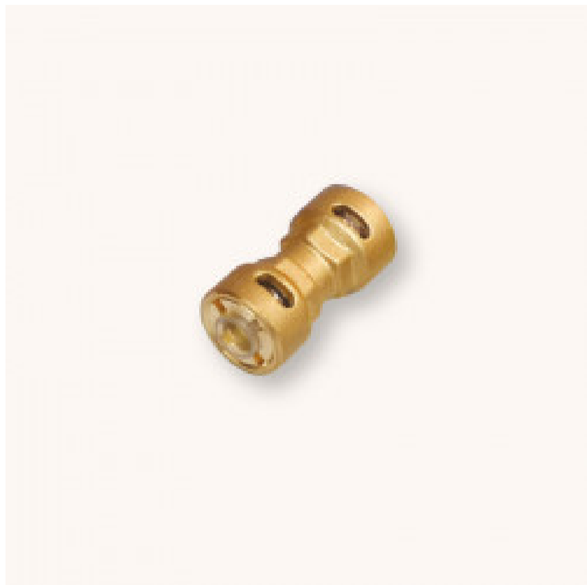
Giunto da 1/4 - Gator

16 altri prodotti della stessa categoria: