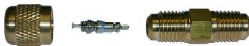
2BA-CORE-CAPS1/4 - Attacco 1/4 SAE maschio - con meccanismo interno - con...