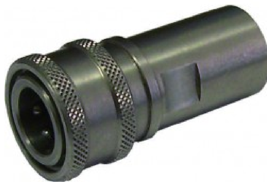
GRFH - Giunto rapido femmina Hansen