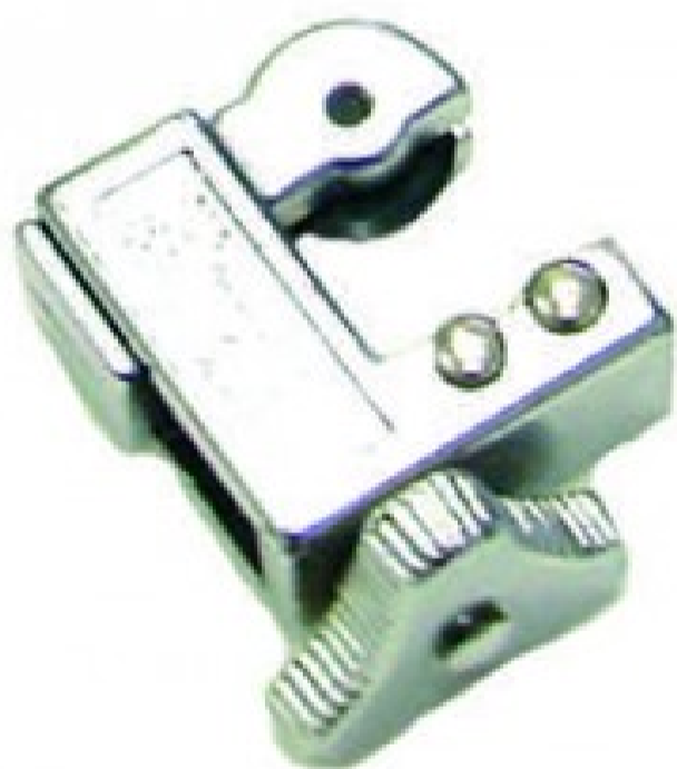
CT-127 - Diametri 3 ÷ 16 mm