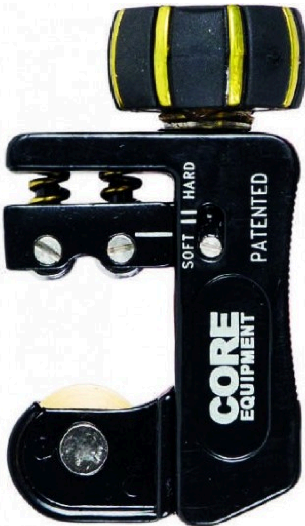
TTBG 3/22 - TAGLIATUBO ALTA QUALITÀ MM: 3÷22 INCH: 1/8÷7/8