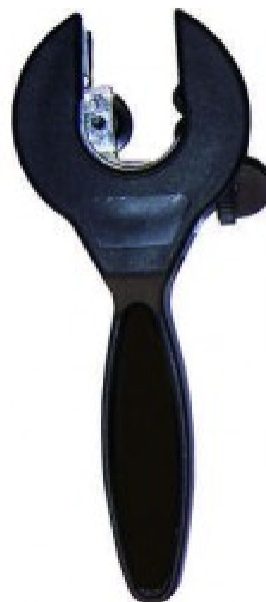
70031 - Tagliatubo a crick - mm 8-28