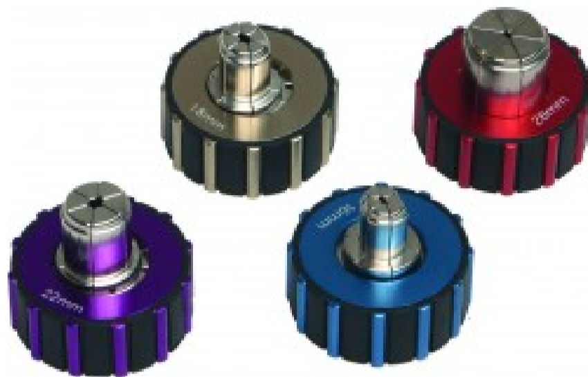
TABG7/8 - Testina allargatubo da 7/8