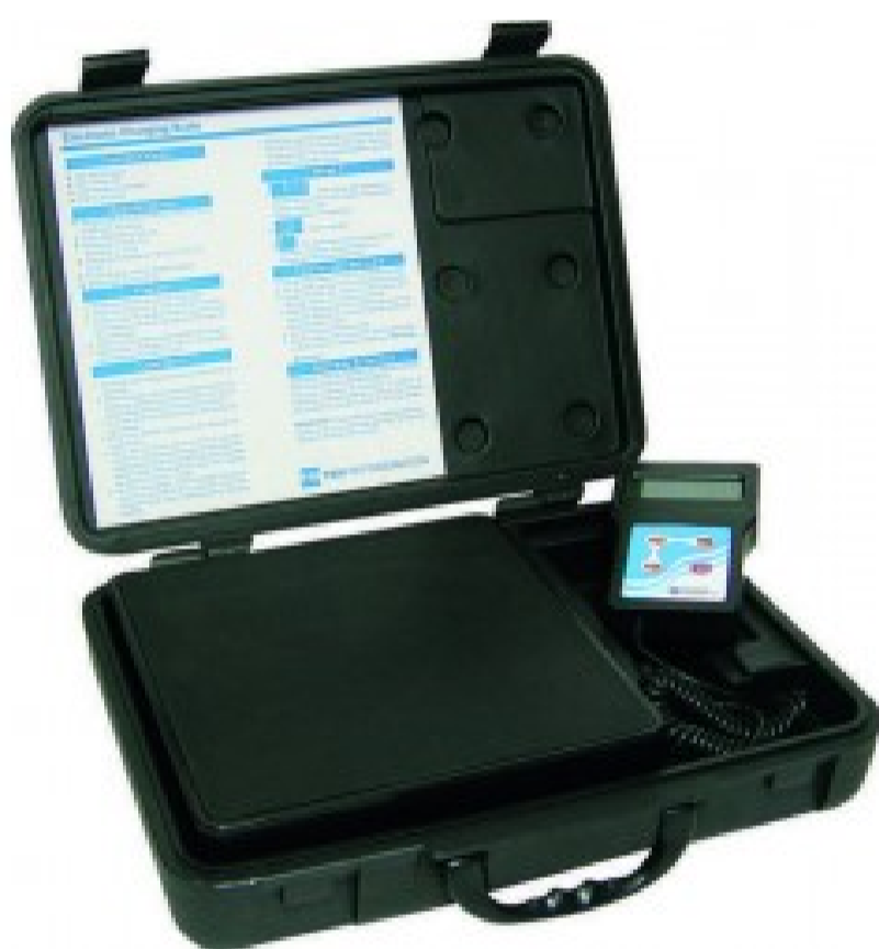
BE120/5 - Kg. 120 - risoluzione 5 grammi con valigia