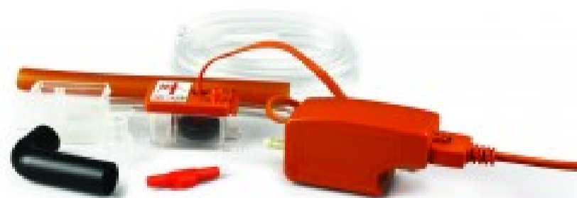
Mini Orange - Pompa rimozione condensa Aspen