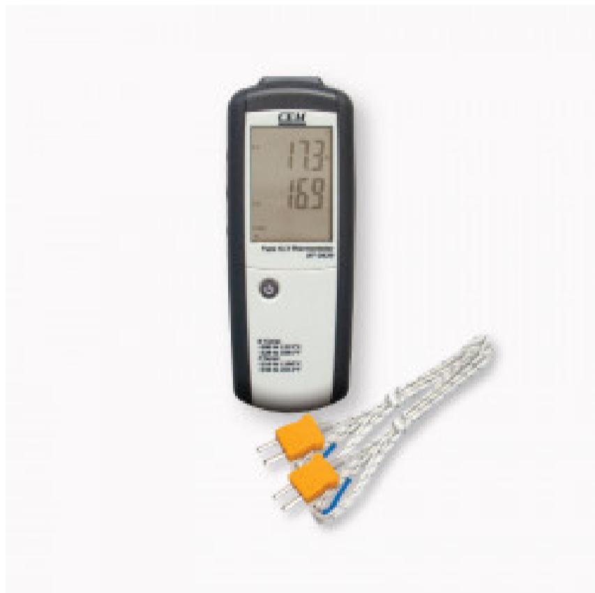
Termometro a doppia sonda di tipo K