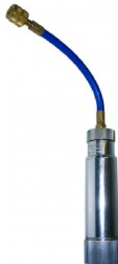
INM - Iniettore