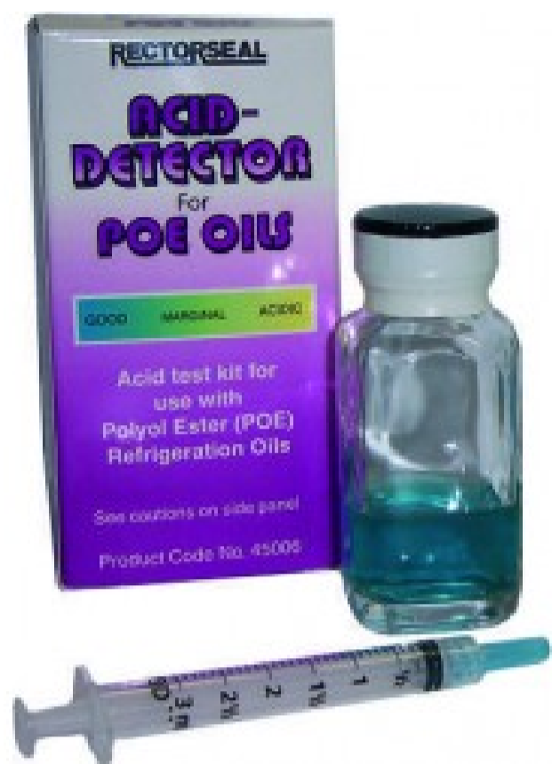
ACID DETECTOR P - Per impianti con olio POE o sintetico

16 altri prodotti della stessa categoria: