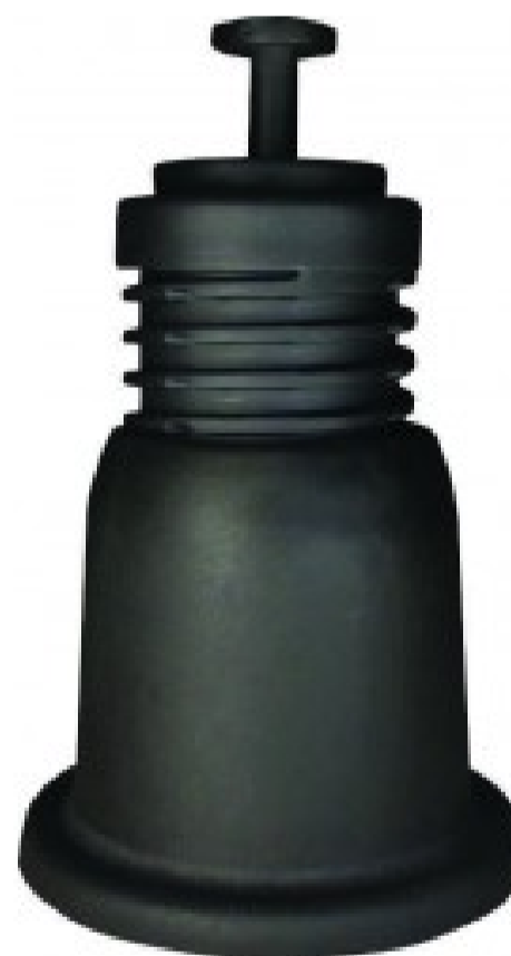
SUPREG - Supporti a pavimento snodabili - 4pz