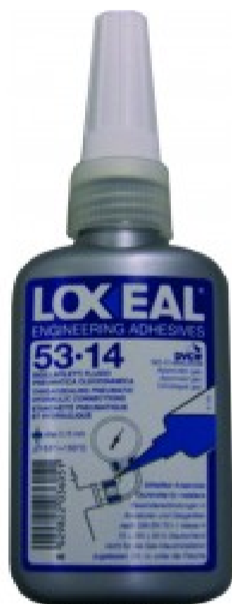
LOX-53-14/50 - Adesivo anaerobico