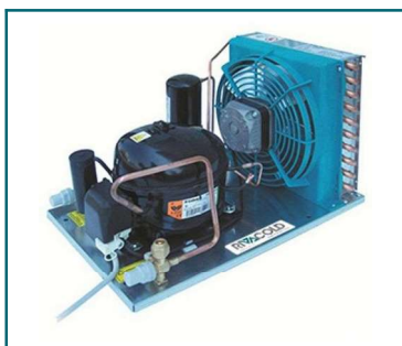
IMMAGINE INDICATIVA PRODOTTO