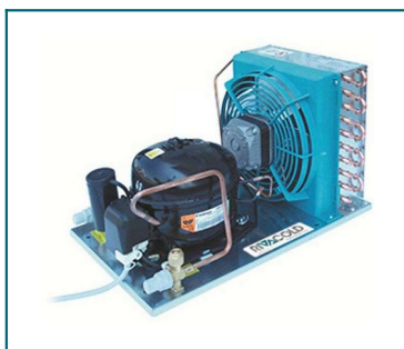
IMMAGINE INDICATIVA PRODOTTO