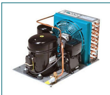
IMMAGINE INDICATIVA PRODOTTO