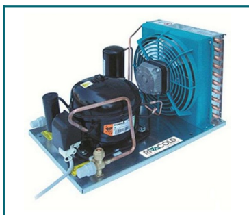
IMMAGINE INDICATIVA PRODOTTO