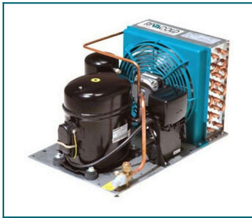
IMMAGINE INDICATIVA PRODOTTO