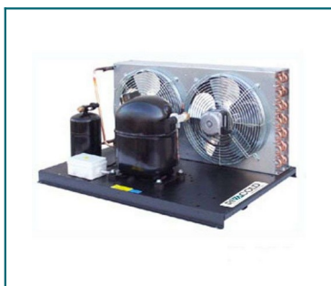
IMMAGINE INDICATIVA PRODOTTO