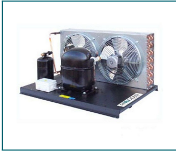
IMMAGINE INDICATIVA PRODOTTO