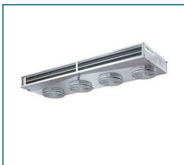
IMMAGINE INDICATIVA PRODOTTO